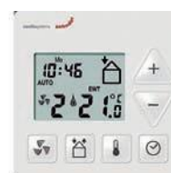
Блок ComfoControl Ease