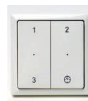
Блок дистанционного управления