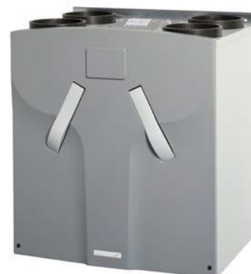
Zehnder ComfoAir 550

Управление работой вентиляционной установкой производится с помощью панели управления, которую размещают, как правило, в гостиной комнате. В стандартном исполнении для управления моделью ComfoAir 550 используется панель управления Ease. Опционально возможна комплектация панелью управления Luxe, что делает управление работой установки еще более простым и интуитивно понятным.