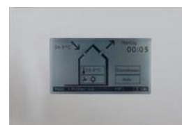
Блок управления ComfoControl Luxe